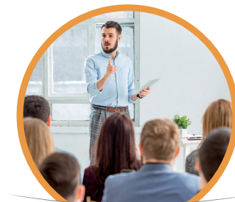
Foto: Alfred Adler

Ausbildung in Kinder- und Jugendlichenpsychotherapie